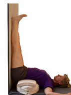
10. Viparita Karani, gegen Wand, über ein oder zwei Polster