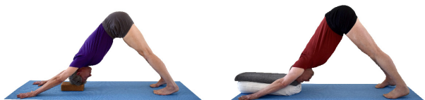
2. Adho Mukha Svanasana, Kopf auf Klotz oder Polster