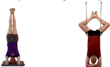
1. Sirsasana , frei, gegen die Wand, oder im Wandseil