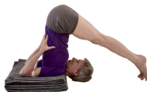
7. Halasana, Zehen auf Boden oder Stuhl