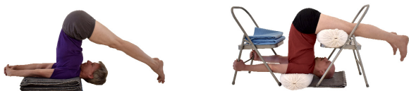
3. Halasana , Zehen auf Boden oder Oberschenkel auf Stuhl