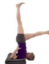
8. Sarvangasana Variationen, frei oder mit Stuhl