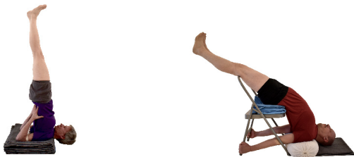
2. Salamba Sarvangasana , frei oder auf dem Stuhl